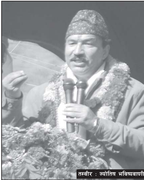
तस्वीर : ज्योतिष भविष्यवाणी

बताउनुभयो। सबै धर्मका बीचमा एकता र सद्भाव कायम गर्न नेपालमा गरिएको धर्मनिरपेक्षताको निर्णय फिर्ता हुनुपर्ने बताउँदै अध्यक्ष थापाले भन्नुभयो, 'नेपालीहरू जुनसुकै पार्टीमा आस्था राख्ने, जुनसुकै धर्म मान्ने र जुनसुकै ठाउँमा बसेको भएपनि हिन्दूराष्ट्र चाहिएको छ।' 'नेपाल विश्वधर्मको उद्गम केन्द्र हो' उहाँले भन्नुभयो, 'इतिहासको प्रारम्भदेखि नै यो भूमिमा बस्ने मानवजातिबीच सद्भाव, एकता र प्रेम रहेको छ, सनातन धर्म वैदिक मन्त्रमा आधारित छ, यो अत्यन्तै उदार मान्यता हो। त्यसैले नेपालका लागि हिन्दूराष्ट्रनै ठीक छ।' 'राप्रपा नेपालले थालेको धार्मिक जागरणले नेपाललाई सनातन धर्म सापेक्ष हिन्दूराष्ट्र पुनर्वाहारी गर्न महत्वपूर्ण भूमिका निर्वाह गर्दछ' पूर्व गृहमन्त्री समेत रहेका थापाले भन्नुभयो, 'हिन्दूधर्मले सबैधर्मसंग समान अधिकार, एकता र सद्भाव कायम गरेको छ, धर्मको आधारमा विवाद र द्वन्द्व नभएको अवस्थामा नेपालमा धर्मनिरपेक्षता उचित छैन।' 'समुद्रमा अन्य नदीहरू मिसिए भैं हिन्दूधर्म भएको ठाउँमा अन्य धर्मपनि आउनु ठीक हो, अन्य धर्मलाई हामीले अतिथि देवो भवः सम्झनुपर्छ, हिन्दू धर्मावलम्बीले अन्य कुनैपनि धर्मको विरोध गर्नु हुन्न' अध्यक्ष थापाले भन्नुभयो, 'सबैलाई समान अधिकारका लागि धर्मनिरपेक्षता ठीक छ तर यहाँ हिन्दूधर्मको कु-प्रचार गर्दै योजनाबद्ध तरिकाले लोभ लालच