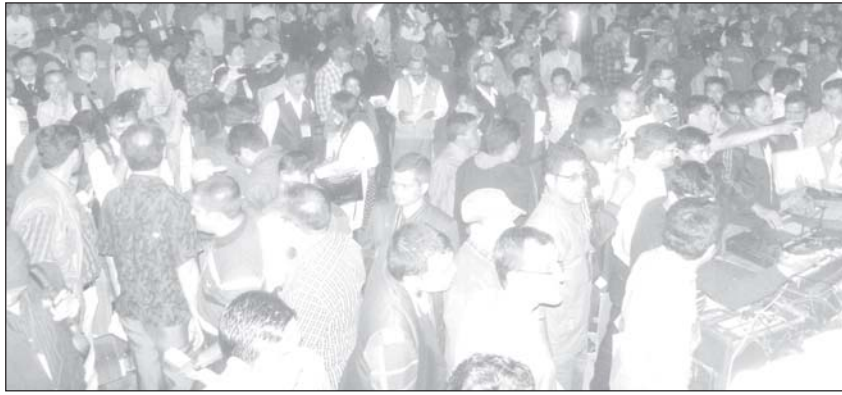
जे देखियो : नेपाल पत्रकार महासंघको बन्दशत्रमा देखिएको पत्रकारहरूको दृश्य।